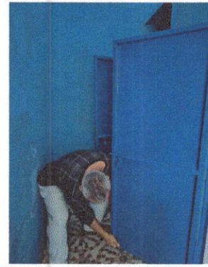
Foto 2: Mantenimiento a estructura (lijado, cambio de tubo , cepillado, sujeciones, aplicación de pintura)