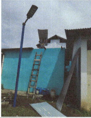
Foto1: Sustitución de lámina, por lámina troquelada aluzinc calibre 26